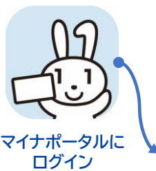
マイナポータルにログイン