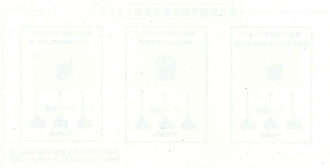
図1 再生医療等製品臨床研究実施計画書の構成

患者登録システムデータベースへの患者データ（患者背景、再生医療等製品の使用状況、有害事象等）の入力