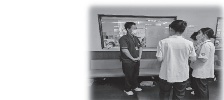
(参考)理学療法士の実習風景

・在宅医療の提供に当たっては、それぞれの専門知識を有する医療関係職種が連携し、質の高いサービスを維持・確保しているところ。 ・そのため、在宅医療における多職種連携に向けて、いくつかの医療関係職種においては在宅医療を想定した実習等を行っている。